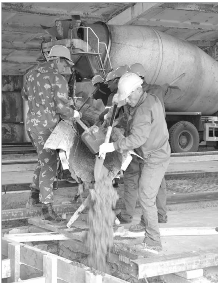
Строительство животноводческого комплекса идёт по плану.