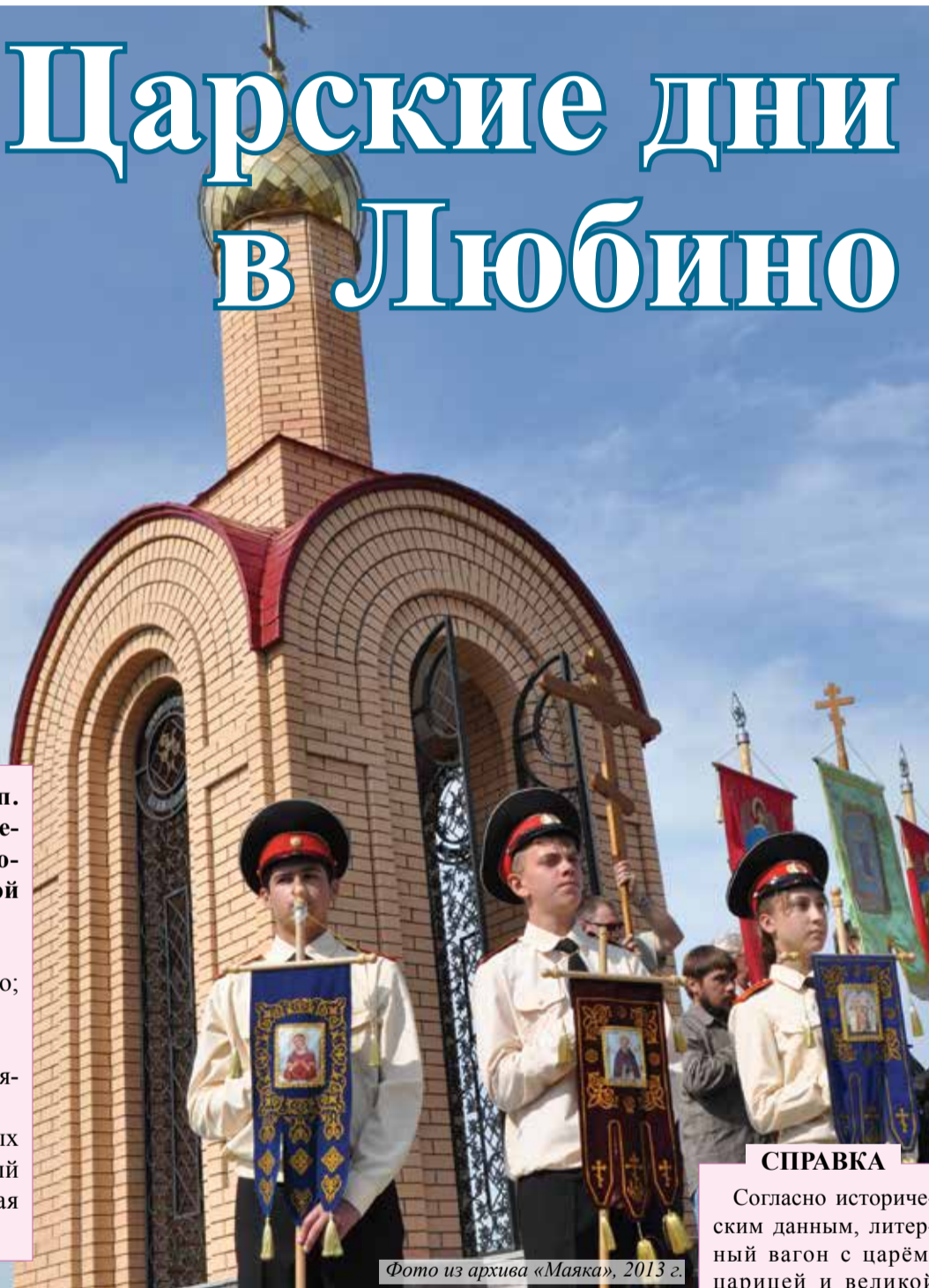
Фото из архива «Маяка», 2013 г.

Сегодня, 18 июля, в р.п. Любинский состоятся торжественные мероприятия, посвященные памяти Царской семьи: