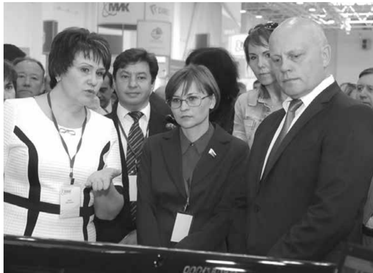
Губернатор В.И. Назаров знакомится с новыми разработками.

В Омской области создана система межведомственного электронного взаимодействия, функционирует государствен-