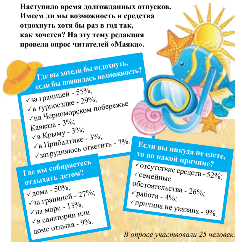
В опросе участвовали 25 человек.

Наступило время долгожданных отпусков. Имеем ли мы возможность и средства отдохнуть хотя бы раз в год так, как хочется? На эту тему редакция провела опрос читателей «Маяка».