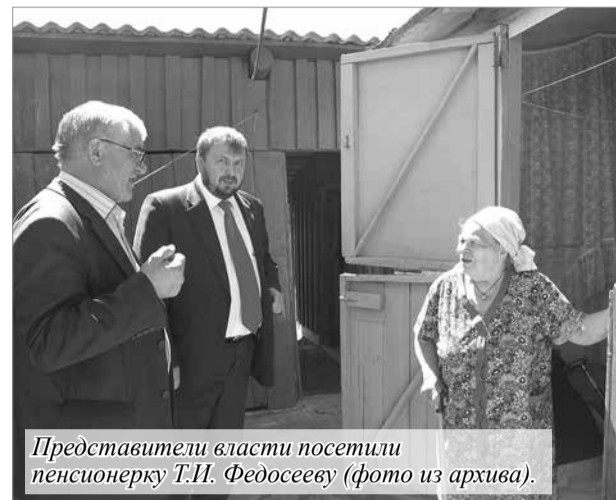
Представители власти посетили пенсионерку Т.И. Федосееву.