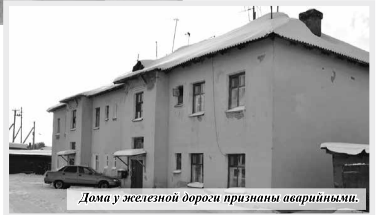
Дома у железной дороги признаны аварийными.

В Любинском районе ведётся переселение жителей 10 многоквартирных домов (32 квартиры), в которых проживает 81 человек. Впервые новое жильё получают не только жители райцентра, но и сельских поселений.