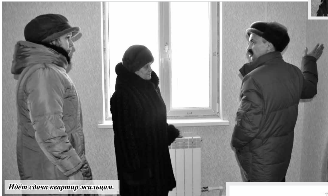
Идёт сдача квартир жильцам.

Но нужно признать, что самостоятельно улучшить свои жилищные условия большинство новосёлов вряд ли смогли бы.