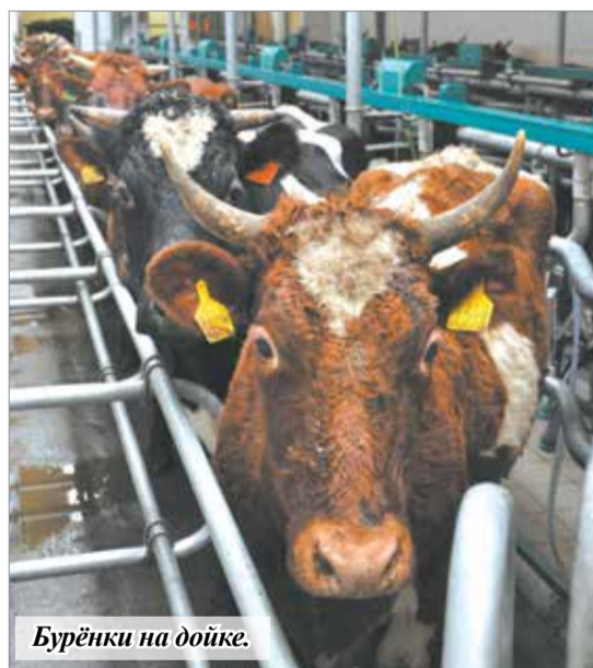
Бурёнки на дойке.

о модернизации животноводческой отрасли. Теперь в СПК на обслуживании 400 буренок задействованы пять доярок, а не десять, как было раньше.