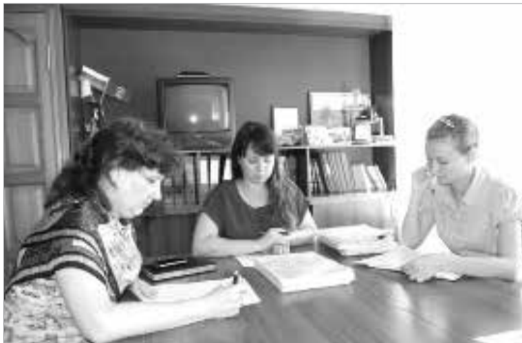
Члены комиссии рассматривают заявления граждан.

Комиссия по предоставлению земельных участков многодетным семьям работает в администрации Любинского района с 2011 года, после выхода указа Президента России об оказании поддержки семьям с детьми. Заседания комиссии проводятся ежемесячно. За три года рассмотрено 218 заявлений от жителей района, на учёт для получения земельного надела поставлены 189 семей.