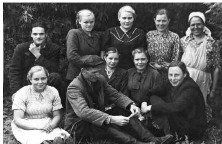
Работники детского дома.

Детский дом представлял собой здание из четырёх деревянных домов, вполне пригодных для жилья. Все постройки были 1900 года и нуждались в большом ремонте. Отопление было печное - 14 печей, на которые требовалось 590 м 3 дров. В 1949 году было выделено 65 тысяч рублей для полной перестройки зданий.