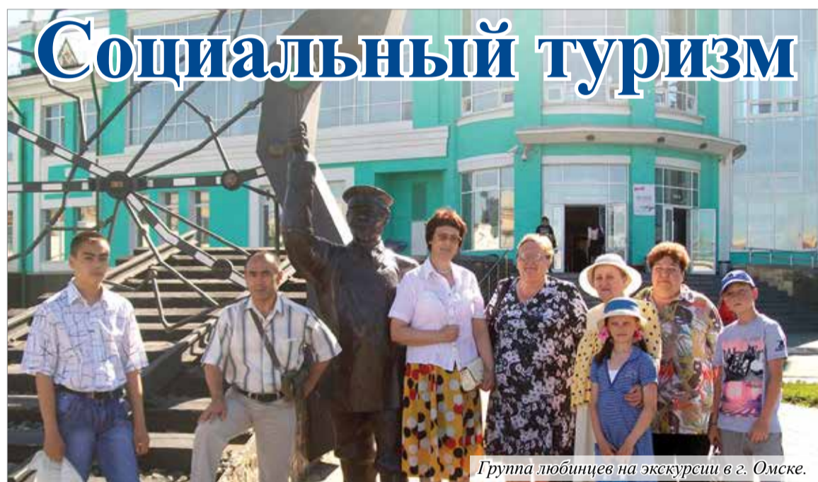
Группа любинцев на экскурсии в г. Омске.

Министерством труда и социального развития Омской области разработан проект программы «Социальный туризм». Её цель - организация экскурсий, мини-путешествий и походов, других видов туристических занятий для граждан пожилого возраста и инвалидов.