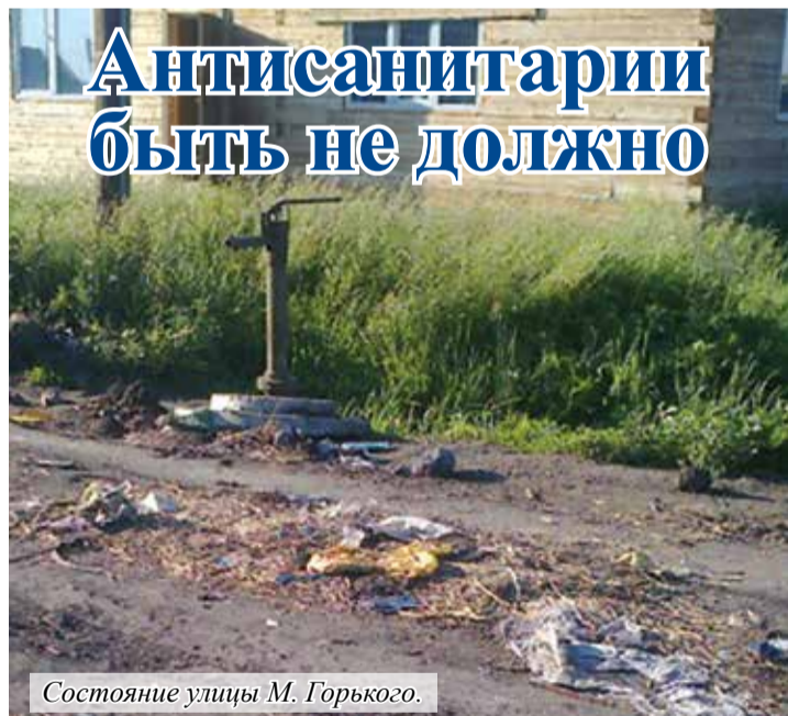
Состояние улицы М. Горького.

В этом убеждена жительница райцентра М.В. Браун, которая описала ситуацию на улице М. Горького.